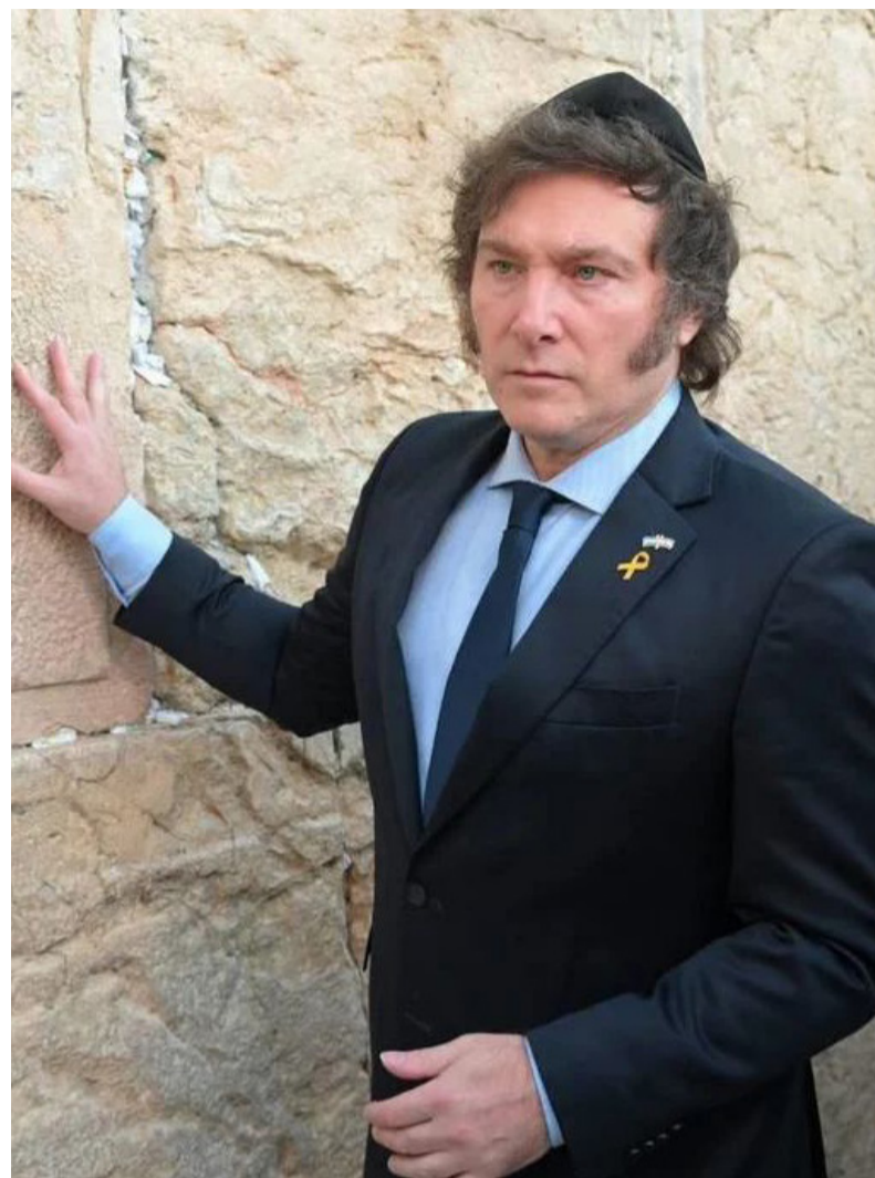
Javier Milei. Ganó el premio de Genesis Prize

La Fundación Genesis Prize anunció este miércoles que el presidente Javier Milei fue galardonado con el “Premio Nobel Judío” 2025 por su contribución y apoyo al Estado de Israel. “Me siento profundamente honrado de recibir el Premio Genesis”, aseguró Milei.