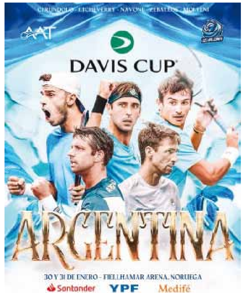
La Argentina, con equipo confirmado para enfrentar a Noruega

El pilarense será piloto de reserva en su nueva escudería, aunque podría reemplazar luego de cinco Grandes Premios al australiano Jack Doohan, quien no estaría ni cerca de ser una debilidad para Briatore, en caso de que no obtenga los resultados deseados.///