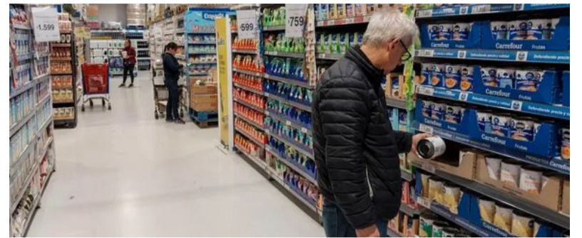
Inflación. Alimentos tuvo la mayor incidencia con 2,2%

El nivel general del Índice de Precios al Consumidor registró un alza mensual de 2,7% en diciembre de 2024 y acumuló en el año una variación de 117,8%.