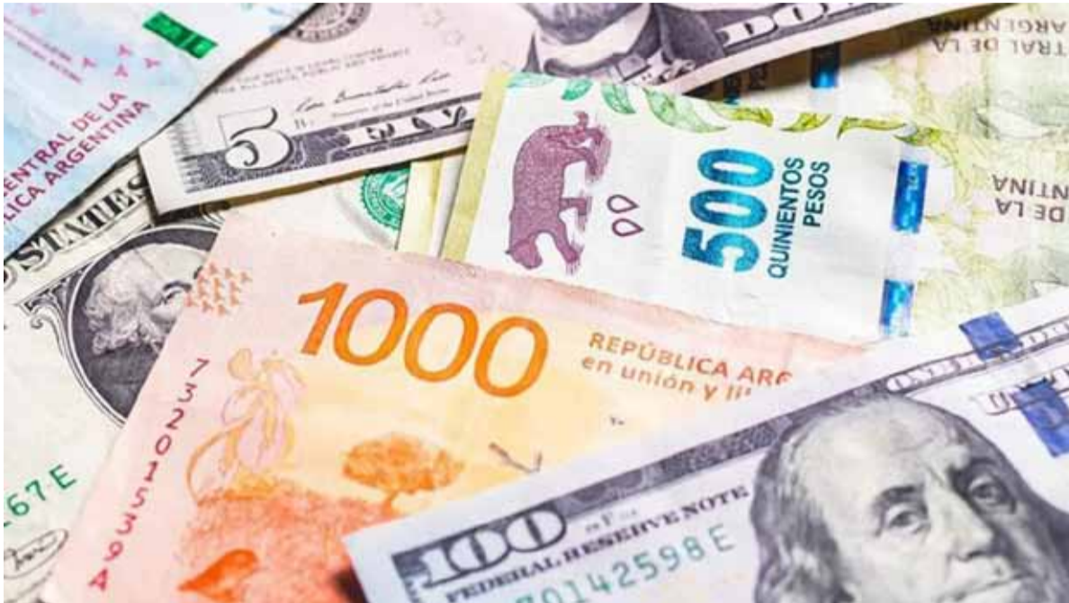
Anuncio del BCRA. El peso se devaluará menos en 2025

Será de 1% mensual frente al dólar oficial según se anunció