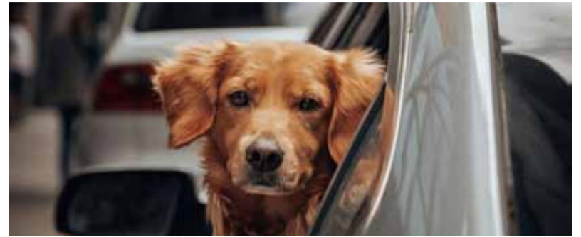
En verano. Aumenta el abandono de mascotas, advierten expertos

“La falta de conciencia social del término ‘tenencia responsable’, sumada a las castraciones no realizadas durante el año, llevan a que durante el verano los casos de abandono de caninos y felinos se incrementen significativamente, generando una crisis que no solo afecta a los animales, sino también a la sociedad en su conjunto”, advierte el Colegio de Veterinarios de la provincia (CVPBA).