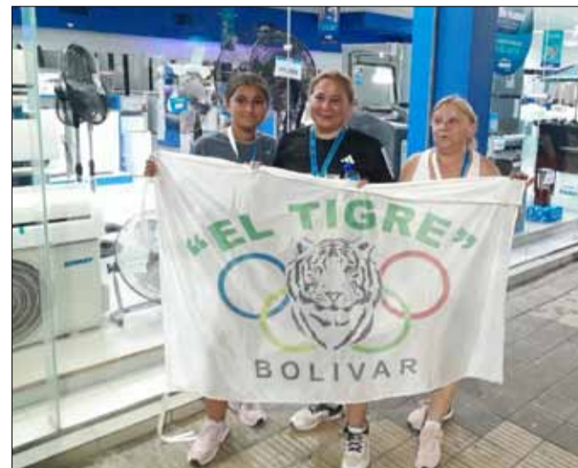
Las tres participantes de Bolívar que tuvo la corre caminata participativa, realizada con fines solidarios.