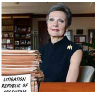
La jueza Preska. Que lleva el juicio contra Argentina por la expropiación de YPF.

“Los acreedores de los fallos contra YPF están exigiendo deta-