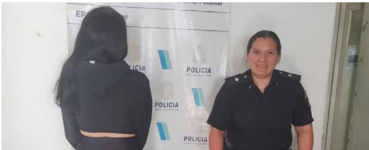
Detenida. La joven conductora del UTV

Una joven corría una picada con un UTV (Utility Task Vehicle) en la playa La Frontera de Pinamar y atropelló a un nene de 8 años que se encontraba en el lugar. La chica, de 19 años, huyó del lugar pero a las pocas horas fue identificada y quedó detenida.