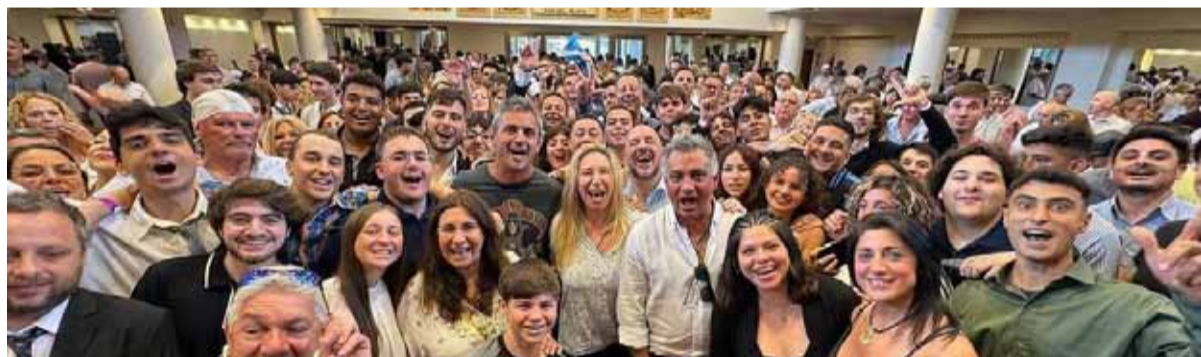
El acto. De los libertarios en el Centro Gallego, en Mar del Plata

Karina Milei protagonizó hoy su desembarco político en Mar del Plata con un acto, cerrado a la prensa, en el que dialogó con la militancia y reformó el mensaje que buscan transformar en consigna de campaña: “nuestro mayor activo con la gente es que estamos haciendo lo que les dijimos que íbamos a hacer”.