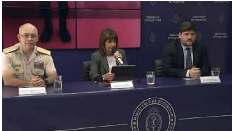
Anuncio. De Bullrich, tras meses de investigación