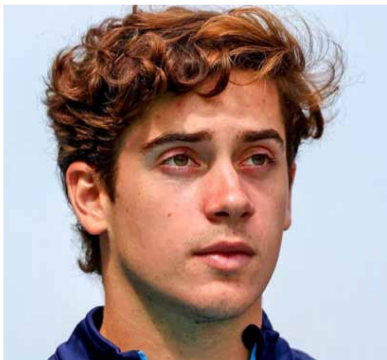
Colapinto. El capricho de Flavio Briatore en Alpine.

A su vez, confirmó que la visita de Horner a James Vowles (jefe de equipo de Williams) durante el Gran Premio de Brasil "fue para entender