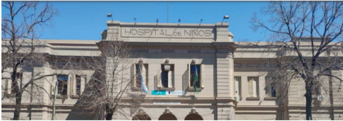
Avances médicos. Para trasplantes en niños en el Hospital Ludovica

El hospital será primer centro en realizar trasplantes cardíacos en Buenos Aires