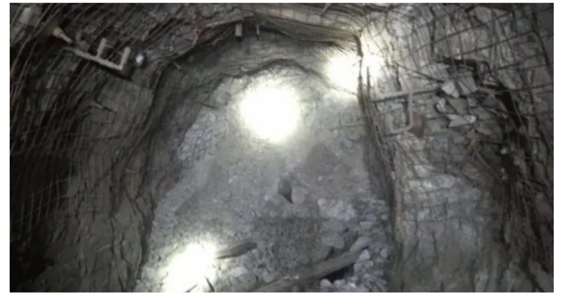
Imagen del acceso. A la mina en la que un derrumbe dejó atrapados a 17 mineros