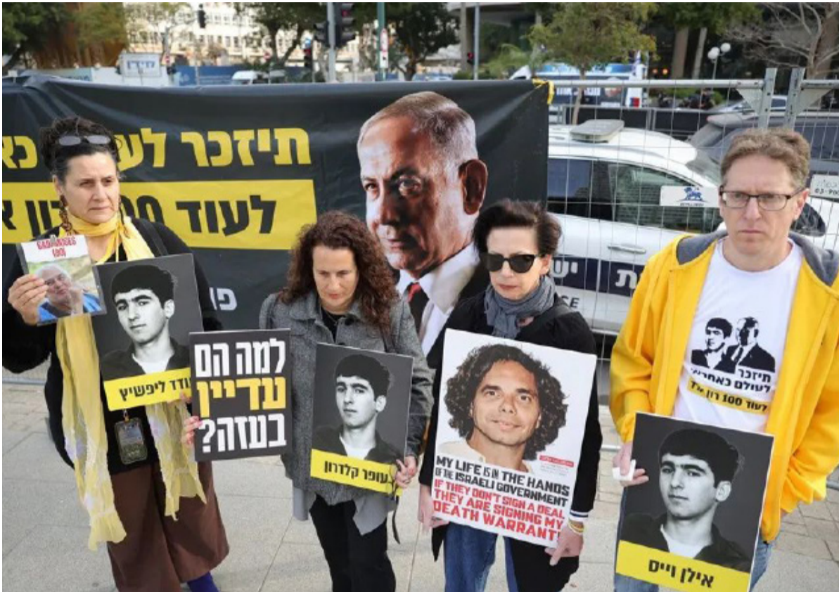
Gaza. Espera en medio de la destrucción un acuerdo de paz entre Israel y Hamas

Las actuales negociaciones en Doha (Qatar) avanzan hacia un acuerdo