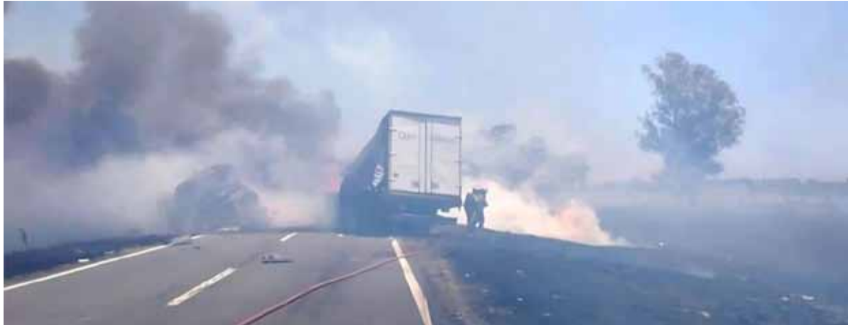
Triple choque. Accidente en Laboulaye

Un fatal accidente ocurrió al este de Laboulaye, donde tres camiones impactaron